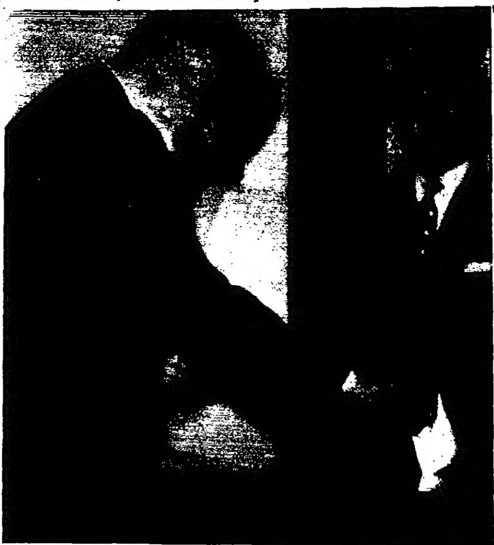
الرئيس جمال عبد الناصر يلقي بصره في الاستفتاء على برنامج ٢٠ آذار